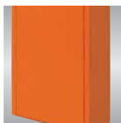
■ Nueva amarre